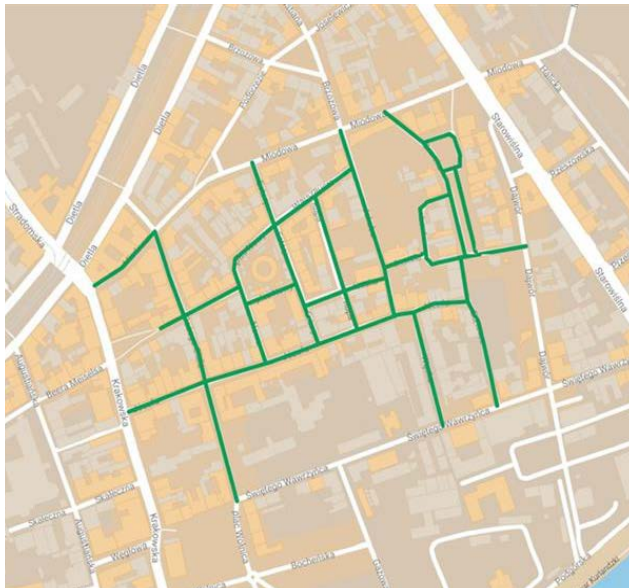
Obszar SCT Kazimierz wprowadzonej Uchwałą 1 zgodnie z jej Załącznikiem 1

Po burzliwej dyskusji Rada Miasta Krakowa ustanowiła strefę czystego transportu „Kazimierz” (Uchwałą nr III/27/18, dalej jako: „Uchwała 1”). W głosowaniu „głównym” za strefą było 22 radnych, 14 głosowało przeciwko, a 3 się wstrzymało. Nieobecnych było 4 radnych.